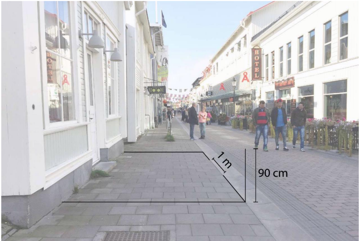
Bild 1: Illustration som visar att uteserveringar längs gågatan ska placeras i direkt anslutning till fasaden och får sträcka sig ut till rännan.